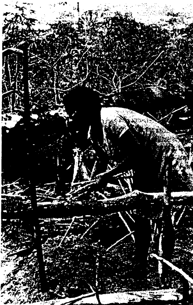
Foto 1. Plantio de mandioca. Índios Wanâna.