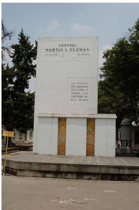
Ilustración 1.—La tumba de la familia Guzmán.

1910, a raíz de un balazo recibido mientras combatía la rebelión orozquista en Malpaso, Chihuahua (Quintanilla, 149). Lleva la superficie del monumento, a mano derecha, una reprimenda sugerente abajo del apellido de Guzmán: “La Patria no siempre recuerda y honra las virtudes de sus hijos”. Nuestro autor está metido adentro de la cripta, bajando unas escaleras a mano izquierda. No pude entrar, porque la puerta estaba cerrada con llave, pero se percibía su nombre claramente a través del vidrio polarizado. En el exterior, más allá del genérico “Familia Guzmán”, no hay ninguna mención del autor de El águila y la serpiente , tampoco ningún busto, o placa conmemorativa. Aunque no fracasó en sus intentos de consolidarse dentro de la genealogía cultural del país, ahora Guzmán ha sido relegado al anonimato relativo de su propia genealogía familiar.