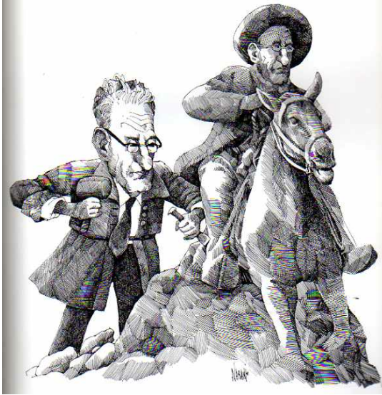
FIGURA 4. Rogelio Naranjo. Martín Luis Guzmán. La insurrección de las semejanzas. (México, D.F.: UNAM, 2005) 43.

Esa ha sido la visión dominante de Guzmán a lo largo de la última mitad del siglo XX. Mas en esta tesis, hemos comprobado que Guzmán no se construye literariamente como un hombre temerario de acción, mucho menos como un héroe revolucionario. La caricatura de Naranjo resulta aun más irónica, tomando en cuenta que Guzmán no logró inmortalizarse en gran escala. Recordemos, por ejemplo, que no existen estatuas suyas en México. ¿Es éste el precio justo que tuvo que pagar por su hubris ? Tal vez, si los dioses fueran griegos, su ignominia actual brindaría cierta simetría.